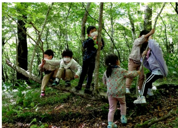
木登り体験の子どもたち

5月中旬から7月にかけて横浜YMCA保育園の年長児が、富士山YMCAにキャンプで訪れます。子どもたちは富士山2合目の西白塚のハイキングも行います。「森のおうち作り」、「木登り」を自然発生的に、自主的に、子どもたちは自然の中で遊びます。木に登れない子に手を差し伸べたり、森のおうち作りでは友だちと協力したり、自然は「見えない力」をたくさん私たちに与えてくれます。自然が近い存在であれば、自然が楽しい時間を与えてくれると、子どもたちが感じてくれれば、自然を大切にしようという心が芽生えてくれると信じて、この森と一緒に歩いています。