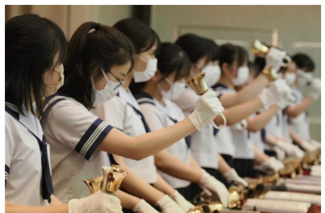
山梨英和高校 聖歌隊のみなさん