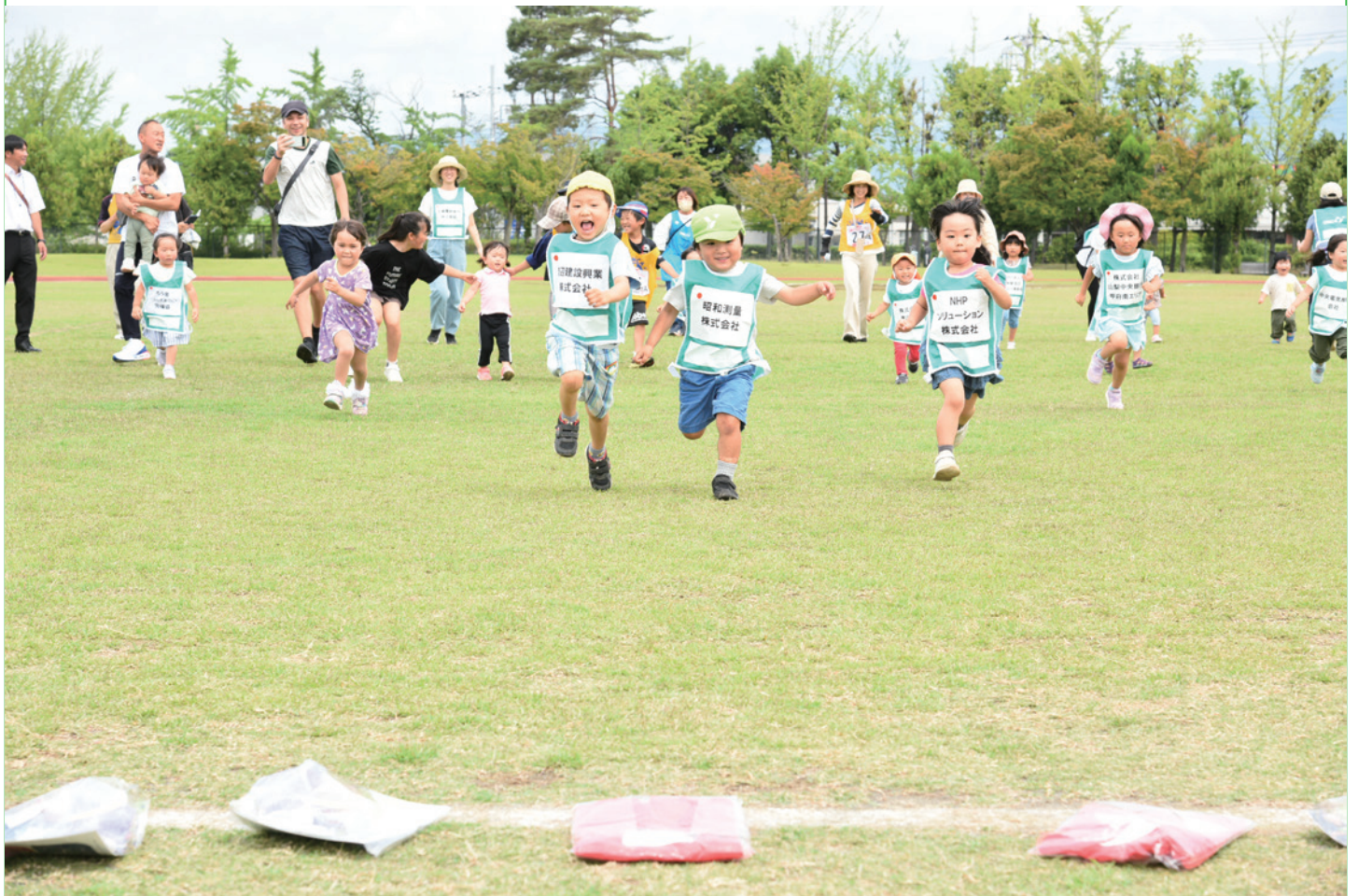
この笑顔に会いたくて・・・来てしまうんだなあ。