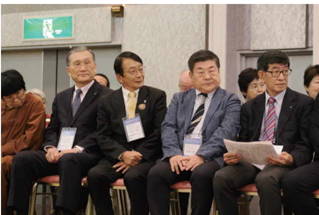
真剣な面持ち・少々お疲れモード