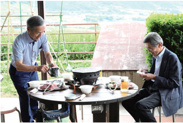
エクスカーションでBBQの二人