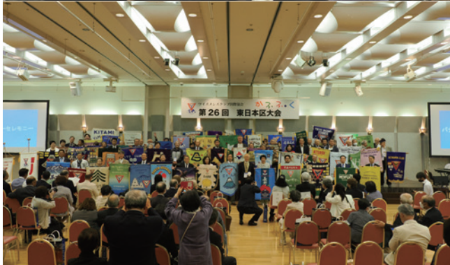
バナーセレモニー