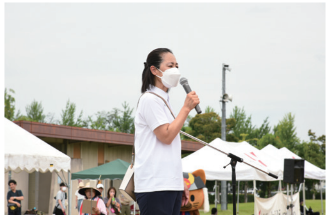
チャリティーランにて

ぜひ一度、山梨 YMCA の穏やかに流れる時間と風に触れていただけますよう心よりお待ちしております。