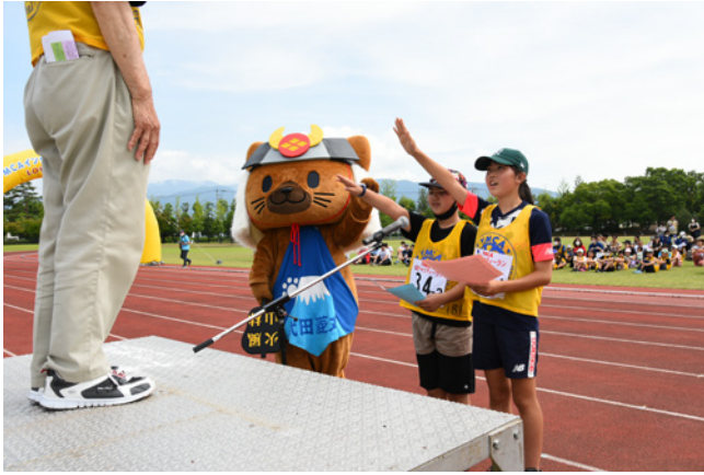
武田菱丸クンと選手宣誓