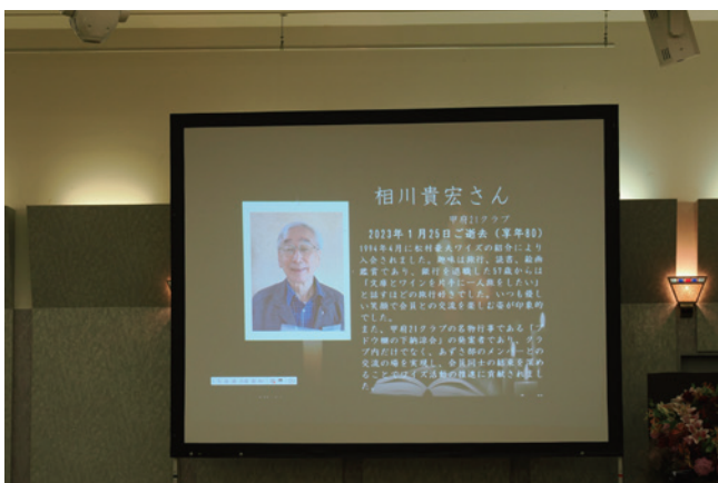
私たちは、忘れません