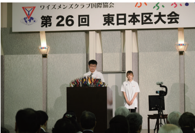
ユースアワー (山梨YMCAリーダー)