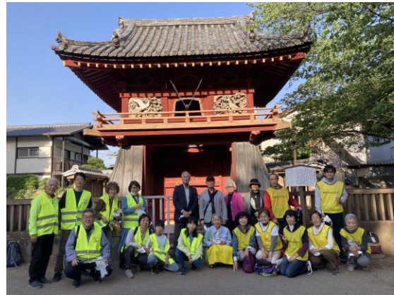
みんなで記念写真撮影