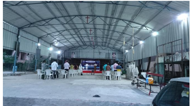
Hyderabad YMCA 仮設建物

また、22日(土)には、Telugu 洲 (Hyderabad は同州の州都) が運営する Tech-Hub を見学させてもらい、クラブメンバーの知人のご息が責任者(?)を務める、World Telugu Information Technology Council(WTITC)を案内してもらいました。この施設は、州政府の肝いりで昨年6月に竣工したばかりで、世界中からIT関連の起業家を集めて、事業立ち上げの準備をすることができる設備と助言スタッフを揃えています。全世界から500名を集める計画で、日本からもぜひ受け入れたいので、私にその橋渡し役の一役をお願いされました。WTITCの主要施設はT-HUBと呼ばれていますので、興味のあるかたは、 https://t-hub.co/ をクリックしてみてください。