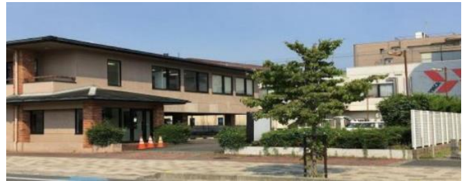
新装となった建物の外観