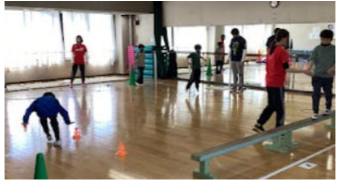
子供会のようなす

このセンターは、すべての子どもが自ら育つ力を伸ばしていけるような働きをすすめ、地域における子育て子育て支援の場として活用していきます。すでに4月からこのセンターにおいて放課後等デイサービスに通う子どもとその親を対象に「おやこの会」を開催しています(月1日曜日)。この会は、子どもは所沢センターのプールや体育館で身体を動かす楽しさを感じ、親は子育て子育てセンターでお茶を飲みながらお話をしてのんびりと過ごすというものです。様々な立場の方々が自由に入出入りしながら、交流できる場です。通年で行っていますので、お手伝いできる方がいらっしゃいましたらぜひご連絡ください。お待ちしております。(パンフレット添付)