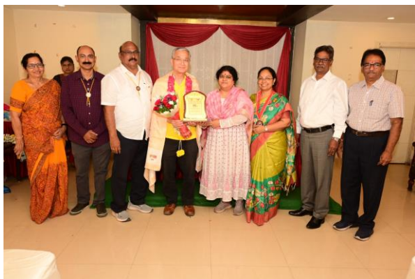
現会長 (女性) から歓迎のショールと盾をいただきました。