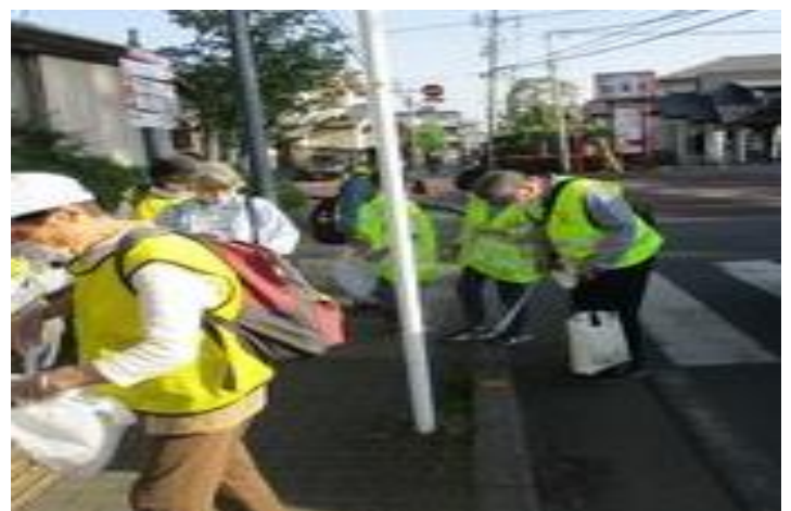
WEEK FOR WASTE

この日はアースデー（地球の日）でしたので、ワイズメンズクラブが行っている WEEK for WASTE（ゴミ拾い）も少しの時間でしたが行いました。