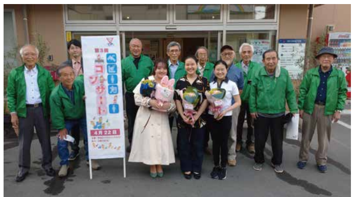
YMCA 玄関には立て看板を用意 ニッコリ。