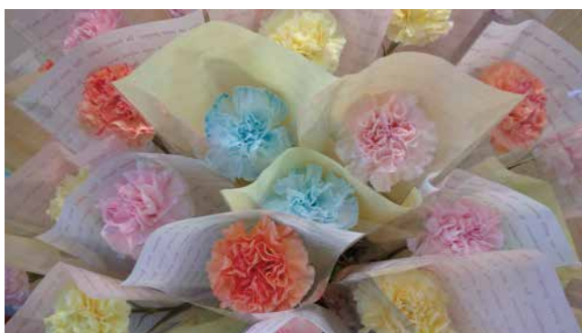
舞台を飾っていたカーネーションをお持ち帰り頂く