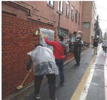
京都パレスクラブ