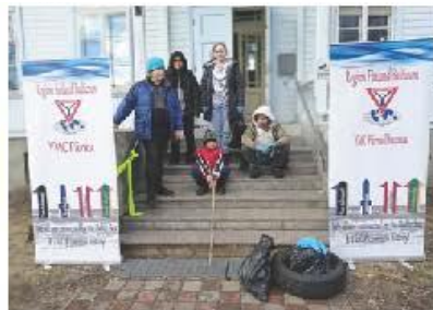
エストニア・パルヌクラブ