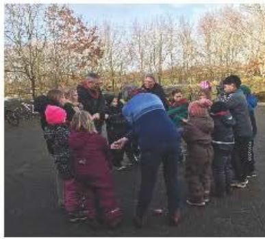
デンマーク・リンケピングクラブ