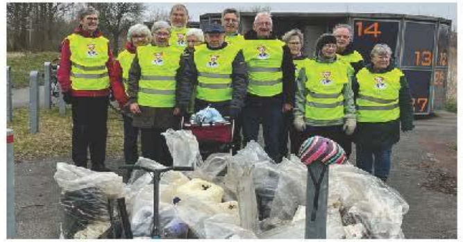
デンマーク・オーフスクラブ