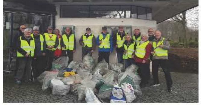
デンマーク・バイレクラブ