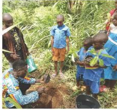
カメルーン・ニュービジョンクラブ