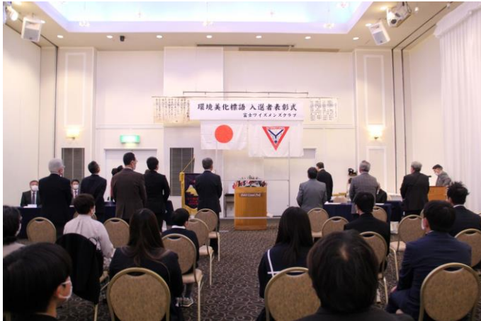
2月公開例会 前列立っているのがメンバー

富士クラブとしては初めての「公開例会」らしき2月例会を2月5日(日)朝10時より開催しました。これには訳があり、例会の中に「環境美化標語」表彰式を組み入れました。12人の表彰者とその家族、美化標語募集の関係者の皆様も例会場に同席していただき、富士ワイズメンズクラブの例会の様子を見ていただき、少しでもワイズメンズクラブを理解していただけたら将来の入会見込みメンバーに繋がることを願い公開例会らしき例会を開催しました。但し例会そのものはメインである表彰式に時間を割くことにより、一応、型どりに済ませました。(書記 増田)