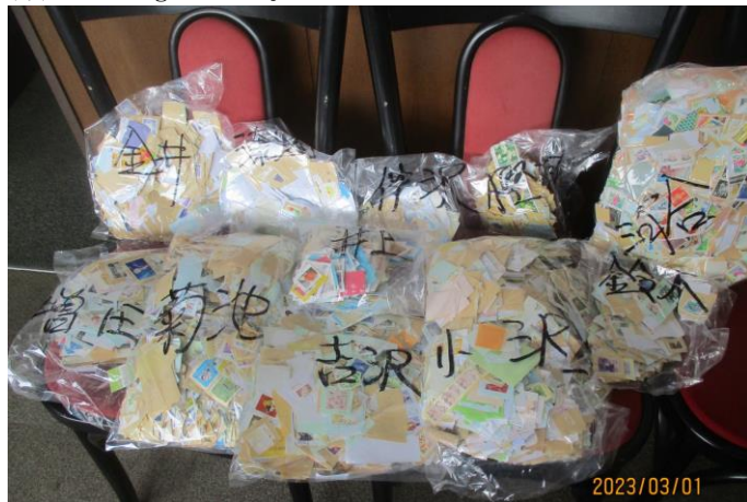
メンバーの善意がこもった使用済み切手です