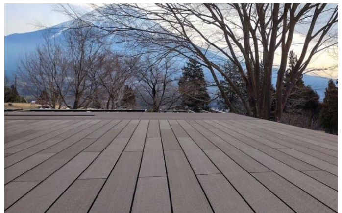
リニューアルした富士山YMCAのウッドデッキ

この度、腐食が進んでいたメインホールのウッドデッキがリニューアルします。雄大な富士山と駿河湾の絶景を一望できるテラスが生まれ変わります。3月中旬に完成予定です。おしゃれで機能性の高いアウトドア用品のブランド「PEACEPARK」とのコラボレーションで提供いただいたアウトドアチェアを持ち込んで、富士山YMCAの大自然をお楽しみください。