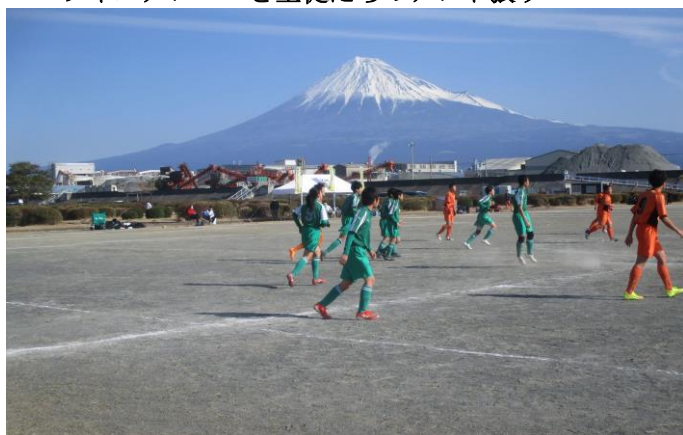
富士山も応援しています