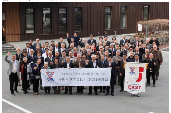
いつも元気な研修会参加者の皆さん。