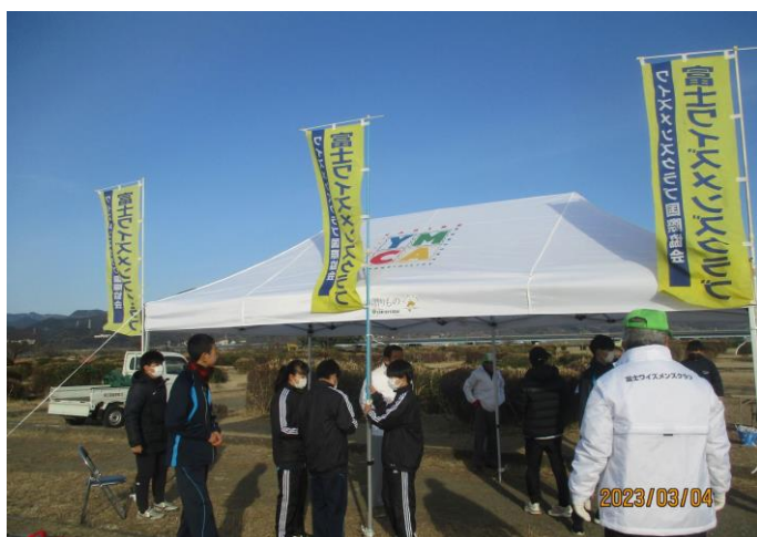
ワイズメンバーと生徒たちのテント張り