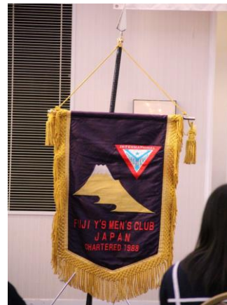
富士ワイズメンズクラブ旗