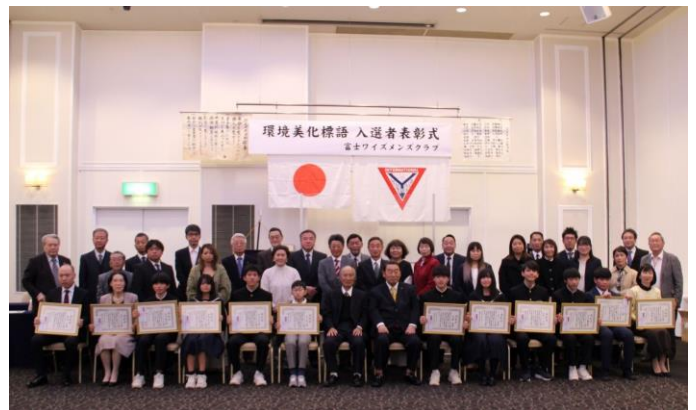
表彰式参加者全員