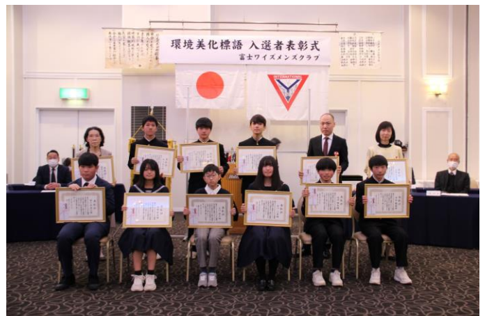
12人の表彰者です。おめでとうございます。