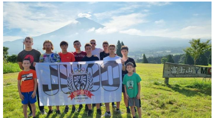
ウクライナ・オデーサの柔道チームのメンバー

8月にウクライナの柔道チームが富士山YMCAに訪れていましたが(ブリテン8月号をご覧ください)、その際に植えたひまわりの種が、比較的暖かかった先月の上旬に花をつけました。ひまわりはウクライナの「国花」でもあります。全国のYMCAでは、ウクライナから日本に避難をしてくれている人々のサポートを引き続き行っております。富士山YMCAからもウクライナの人々のことを思うとともに、1日も早い平和が訪れることを祈りたいと思います。