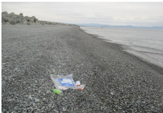
駿河湾の海岸線。この先が沼津、伊豆半島です