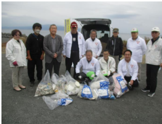
参加メンバーのみな様、寒い中お疲れさまでした。