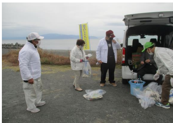
拾い集めたプラスチックごみを整理するメンバー

11月20日に鈴川海岸の海岸清掃を行いました。富士ワイズメンズクラブのメンバーの他、ご友人、ご家族を含め12名にご参加いただき、約1時間の清掃活動を行いました。ペットボトルやお菓子のゴミ、ビニール袋など、明らかに「誰かがどこかで捨てたゴミ」がほとんどで、その人たちの意識が変わればゴミがなくなるのではと当たり前ながら思われます。今回の海岸清掃は、地球の規模からすれば小さいこととは思いますが、これがきっかけとなり、私たち自身、周囲の人々の意識を高めていければと思います。「Think globally, act locally.」と、このような小さな活動でも継続して行い、SDGsを進めていきたいと思ひます。