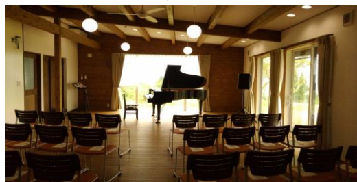
多目的研修棟でのピアノ演奏会の様子

富士山 YMCA 開設10周年を記念し建設された多目的研修棟。今までも多くの方の利用があります。正面には富士山を、横には、伊豆半島や駿河湾の景観が映えます。トイレ、洗面、冷蔵庫、シンクなども付いています。会議、研修の目的ではなく、多目的な用途があり、今までには、地域の音楽教室のピアノ発表会や学校利用での工作スペース。ファミリーでの懇親会。これからは、「Wi-Fi」を活用した、リモートワークスペースなどにも活用できます。ぜひ、皆さんと一緒に、多目的研修棟の利用を考えていきたいと思います!!