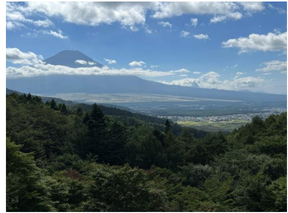
忍野 二十曲峠展望テラスより