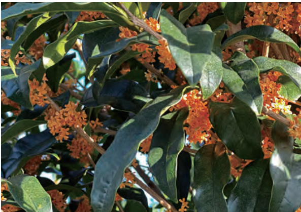
金木犀の花言葉 「謙虚」「謙遜」

この実りの秋、食欲の秋、紅葉の秋こそ、私たち大人はもう一度考え行動する必要があると思います。いつも当たり前の味、当たり前の風景、当たり前の匂いは人のものでなく、自然からの贈り物だということを忘れることなく感謝を持ち堪能したいと思います。