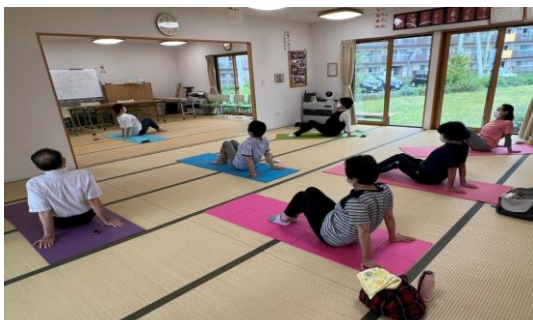
↑ストレッチヨガ風景 ↓左・第1部、右・第2部参加者