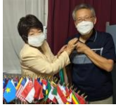
👉 直前会長バッチ着装