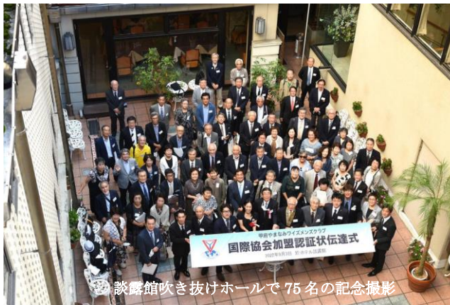
談露館吹き抜けホールで75名の記念撮影