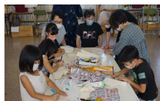
↑紙飛行機作りに挑戦