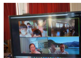
↑東京からオンライン参加者