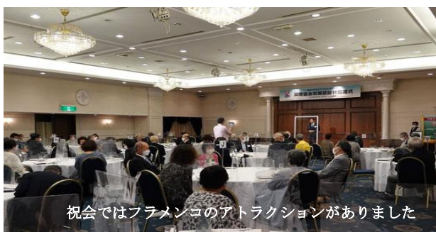
祝会ではフラメンコのアトラクションがありました

約400年前、慶長遣欧使節船として運航されたサン・ファン・パウティスタ号は1993年に国内外の人々の募金等により復元されたが、現在は解体され係留地渡波サンファン館のドックにはその雄姿はない。今月はその文化、歴史的価値について川上ワイズに「サンファン号の遺産を継ぐ」と題して卓話をお願いした。