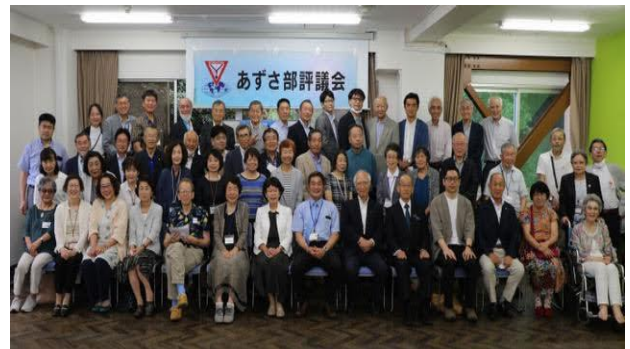
あずさ部 第1回「うぶごえが聞こえる」評議会