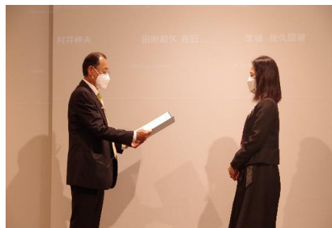
主事認証授与式 2021年度主事認証者

存在の大きさを実感した。子どもたちはYMCAを「母さんの遊び場＝職場＝最高の場所」と呼んでいる。