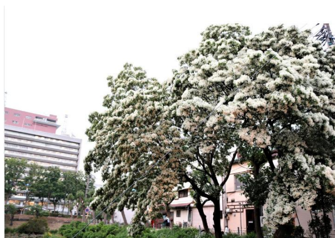
雪が降り積もったような景色です。なかなか綺麗でしょ。

ところ、水戸黄門「ほほう、なんじゃもんじゃ、と申すか」と理解してしまったり。そんな木がなぜ鶴が池のほとりにあるのだろうと不思議になりますが、絶滅危惧種という事で貴重な植物です。