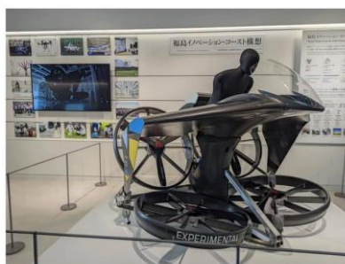
空飛ぶクルマのディスプレイ

しているのをジッと見つめたのでした。私には忘れられない一つの記憶があります。この同じ双葉町の、だれもない野原に立って、「 70\mu\text{Sv/h} 」を手許の測定器で確認したことがあるのです（「 0.3\mu\text{Sv/h} 」で、人は退避しなければならないのです。それはたしか、2013年のことでした。その前にも、それ以降も、私は、瓦礫も手付かずだったあの場所に、何度も何度も、立ちました。今、時間がたって、そこに人は生きている。除染しても「仕切れない」この場所に、しかし人は、確かに今、生活している。そのこと自体が、道義的には、やっぱり「おかしい」と、実感するのですが、でも、事実、そこには命が残されて——言葉がうまく出てきません。実に、釈然としないのです。それが、つまり、原子力被災地です。それはきっと、この世界は「灰色」であるという受け入れ難い事実を、私たちに突きつけている。その現実、慣れることは、なさそうです。でも、その剥き出しの不条理に、たとえばクリスチャンである私は、はっきり十字架を見る。その向こう側に復活を望見しながら、LEDのようにキラキラしている人為的な灯に、目を奪われないよう、気をつけながら。