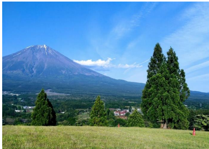
富士山 YMCA から 6 月の富士山を望む

シーズンのキャンプも準備が進んでいます。子どもたちがこの大自然の中で様々な体験をし、自分の価値を見つけ、将来はリーダーとして YMCA を支え、YMCA の活動や社会の担い手となることを願います。