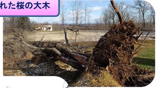
根こそぎ倒れた桜の大木

2年間、山菜ファミリー例会はできませんでしたが、今年こそは、炭火のジンギスカンと山菜料理を囲んで、歓談し、大キャンプファイヤーを皆で楽しみにしています。