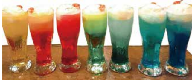
選んだ色で性格がわかるとか。7色のクリームソーダー