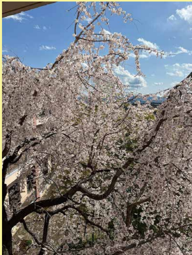
しおベテラス梨の木 3階より 山口 了