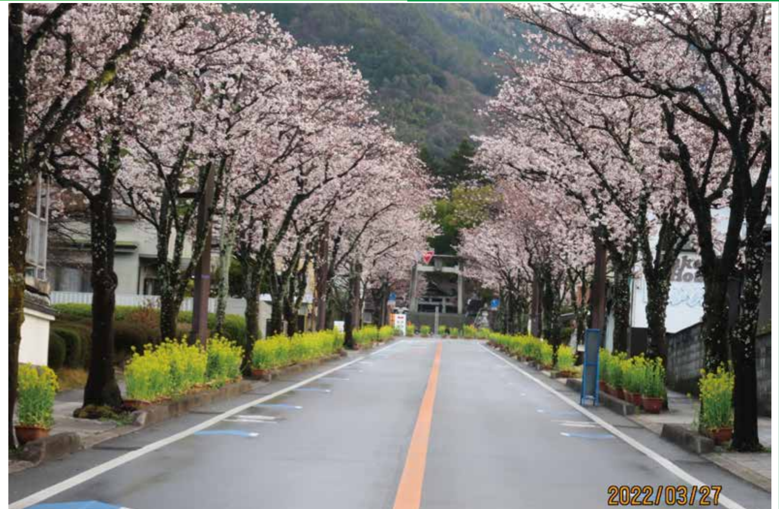
武田通り沿いの菜の花と桜