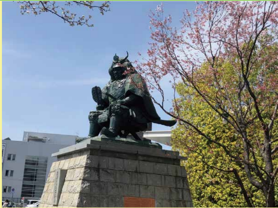
信玄公と桜 藤原琢也