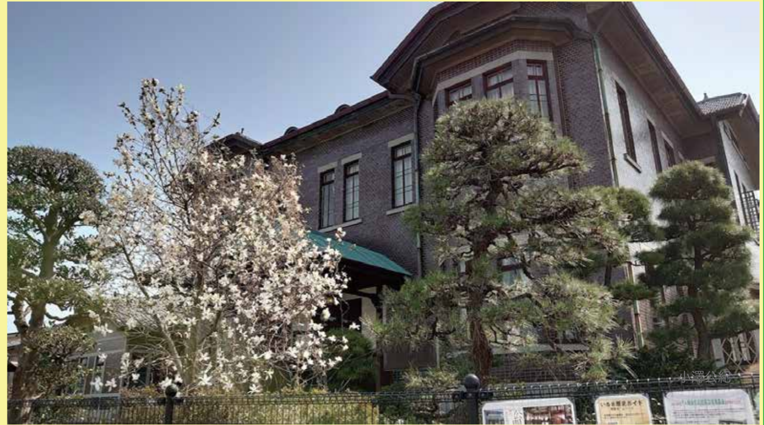
3/25 所沢クラブ花見会にて 埼玉県入間市 旧石川組製糸西洋館