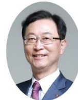
国際会長 キム・サンチェ