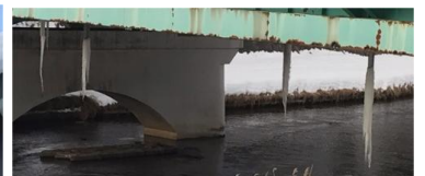
市内、中の橋のつらら、4本あります。