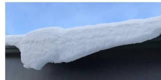
屋根から垂れた雪凍ってそのまま

つららができるのは、もう少し先でしょうか？ でももうすぐ2月になります。春の香りがする時期なのですが天気予報では厳しい冷え込みがあと1週間は続くと言っています。この間に節分がやってきて、暦の上では春を迎えます。エルサちゃんもう雪のお城に帰ってもいいよ。岩手山にいる冬将軍と一緒にどっか行け～。