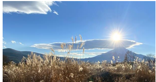
富士と雲とおひさま