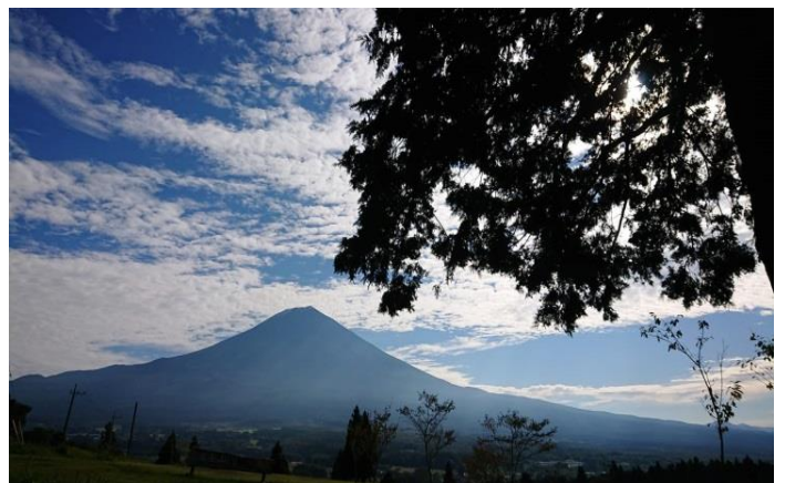
朝霧高原にも秋の気配が・・・

10月に入ると気温も涼しくなり、キャンプのシーズンになってきます。現在予約を受け付けている11月までの土日のテントサイトは、既にほぼ定員になっています。富士山 YMCA からは初冠雪をした富士山（融けてしまいましたが…）と、ススキの草原とのツーショットを楽しむことができます。9月まで実施していた「静岡県民・山梨県民感謝デー」（毎月第一日曜日は静岡県・山梨県在住の方の日帰り入場料が無料！）が12月まで延長されます。ぜひご家族と遊びにお越しください。