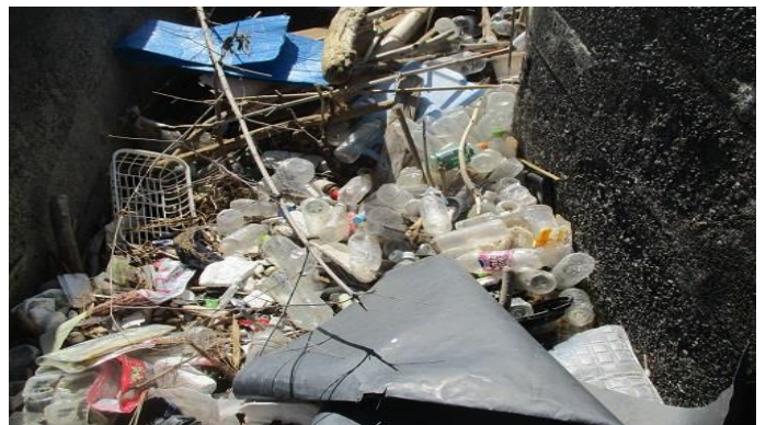
凄い量のペットボトルと流木の山です