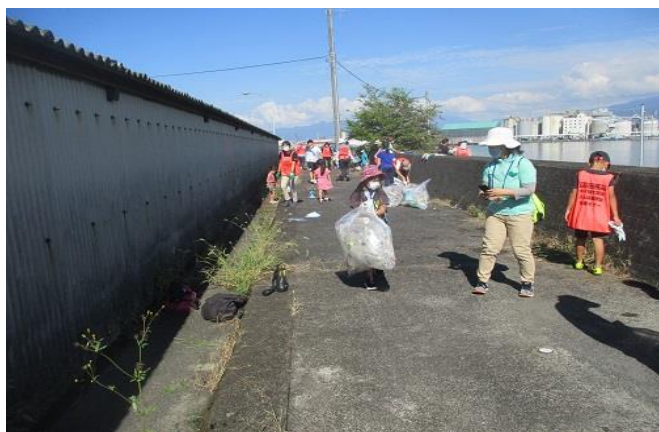
子供たちも大人に負けないくらいに頑張っていました 20人位の子供たちが参加していました