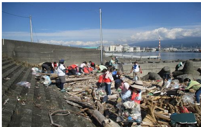
今回はペットボトルと缶を主体に回収しました