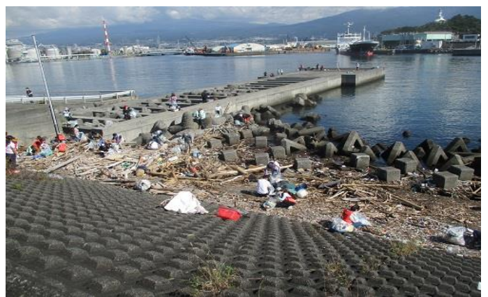
港西側の突堤付近は漂流物のたまり場所になっている