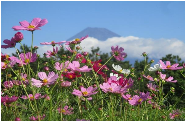
みなと公園からの富士山 (2021.10. 9)