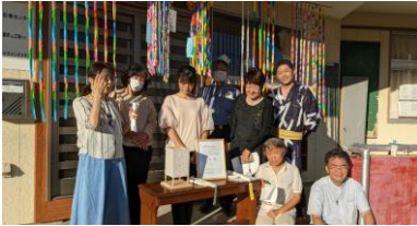
仙台 YMCA ホール↓