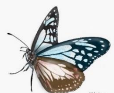
chestnut tiger butterfly