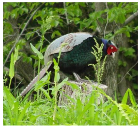
ケンケン、この後羽ばたく、うるさい。