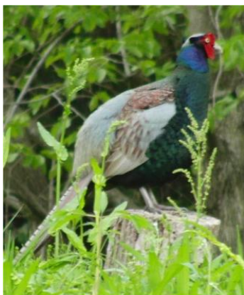
切り株に乗ってあたりを見渡す

すね。その前2週連続で、自主隔離で自宅に閉じこもっていました。余りある時間を持って余しておりましたのに、ブリテンを書けないのはいったいなぜ？自分でもわかりません。ただただ時間が過ぎて現在に至っております。だれか助けて下さい。