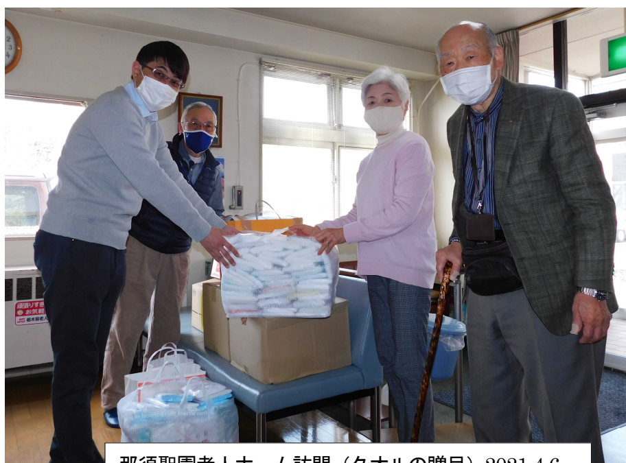
那須聖園老人ホーム訪問（タオルの贈呈）2021.4.6

今後もとちぎYMCAに関わる全ての人にスタッフとして何が出来るか、担当主事となりワイズとYMCA・リーダーの架け橋となれるよう常に考えながら一日一日を過ごしていきたいと思えます。