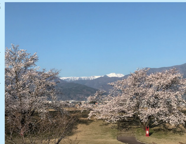
信玄塚の桜 遠方の白い山は農鳥岳 3.26/興水

4月第一例会は、戸田秀幸さん、内田良幸さん、清水公一さんの入会式が予定されています。EMC委員長の宮岡メンの働きによるものです。感謝！