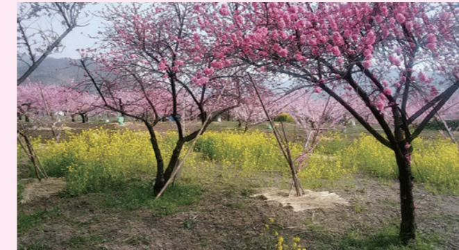
分け入っても、分け入っても 桜源郷 / 寺田

【桜号】毎年4月号では桜通信をお届けしていますが、今年は締め切り日の関係で、少々応募が少なかったのが残念です。(後藤)