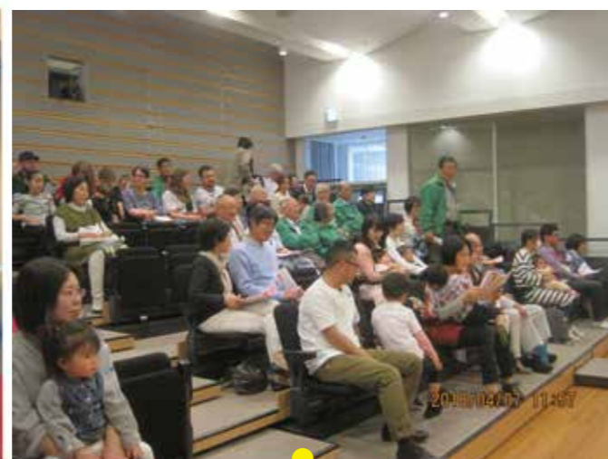
甲府21ワイズメンズクラブ創立20周年記念式典 2010年11月6日 岡島ロイヤル会館