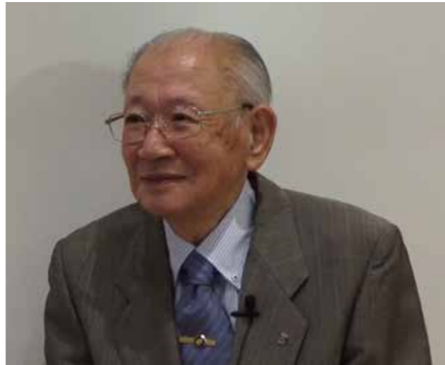
2020年9月記念誌インタビュー