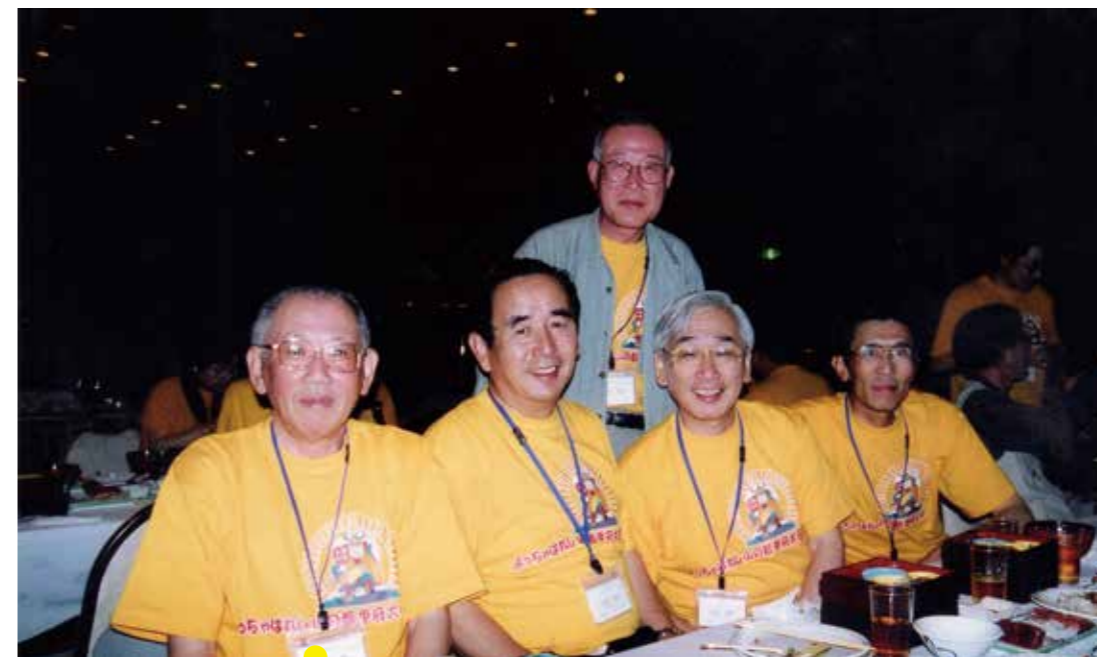
2005年6月11日～12日東日本区大会甲府富士屋ホテル