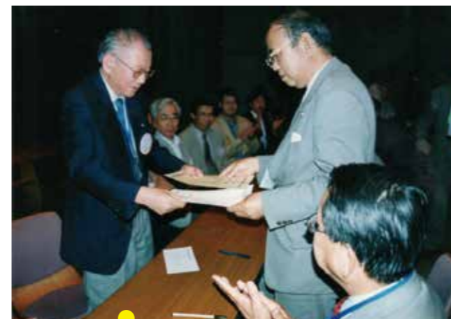
2003年6月 草津クラブとのDBC締結