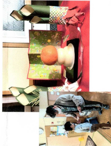
右 1月1日 お正月 Sユニットのお飾り 園長からのお年玉

12月に那須ワイズメンズクラブよりクリスマス献金をいたしました。社会福祉法人養徳園よりお礼のお手紙が届きました。