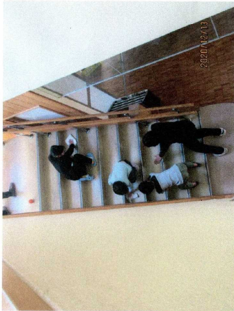
左 12月13日 大掃除