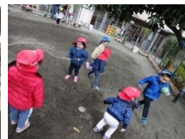
更地になった園庭で 広々と遊んでいます