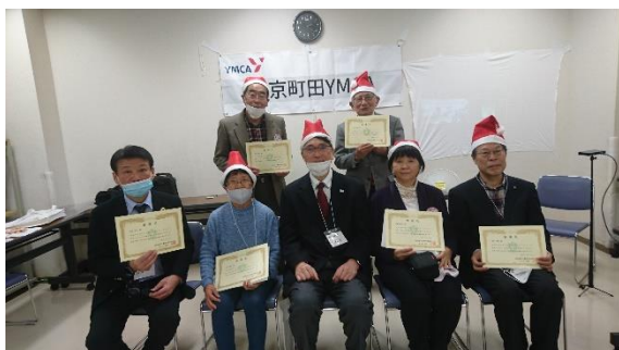
町田 YMCA 30周年記念永年ボランティア顕彰式