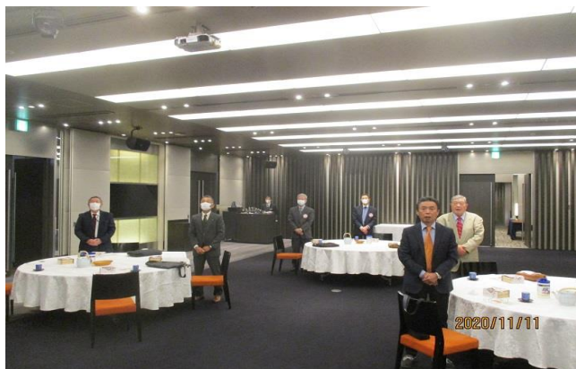
密に徹して11月例会を開催

※新年富士・富士宮合同例会はコロナ禍のため、富士クラブ独自で行うことを富士宮クラブに連絡することになりました。