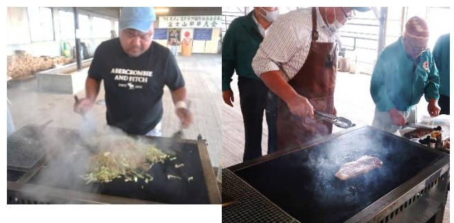
専門家が作る富士宮焼きそばと特別ステーキ