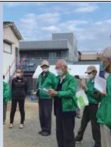
明確な指示と実行