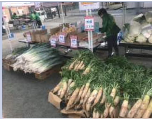
市場顔負け 野菜売り場