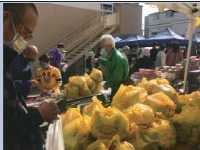
毎年人気のお菓子の福袋