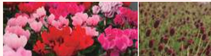
11月の花 シクラメン 右11月19日の花 吾亦紅

花で彩る 長寿お祝い ご注文承ります。 フローリストあかね 電話・ファクス 055-222-8741