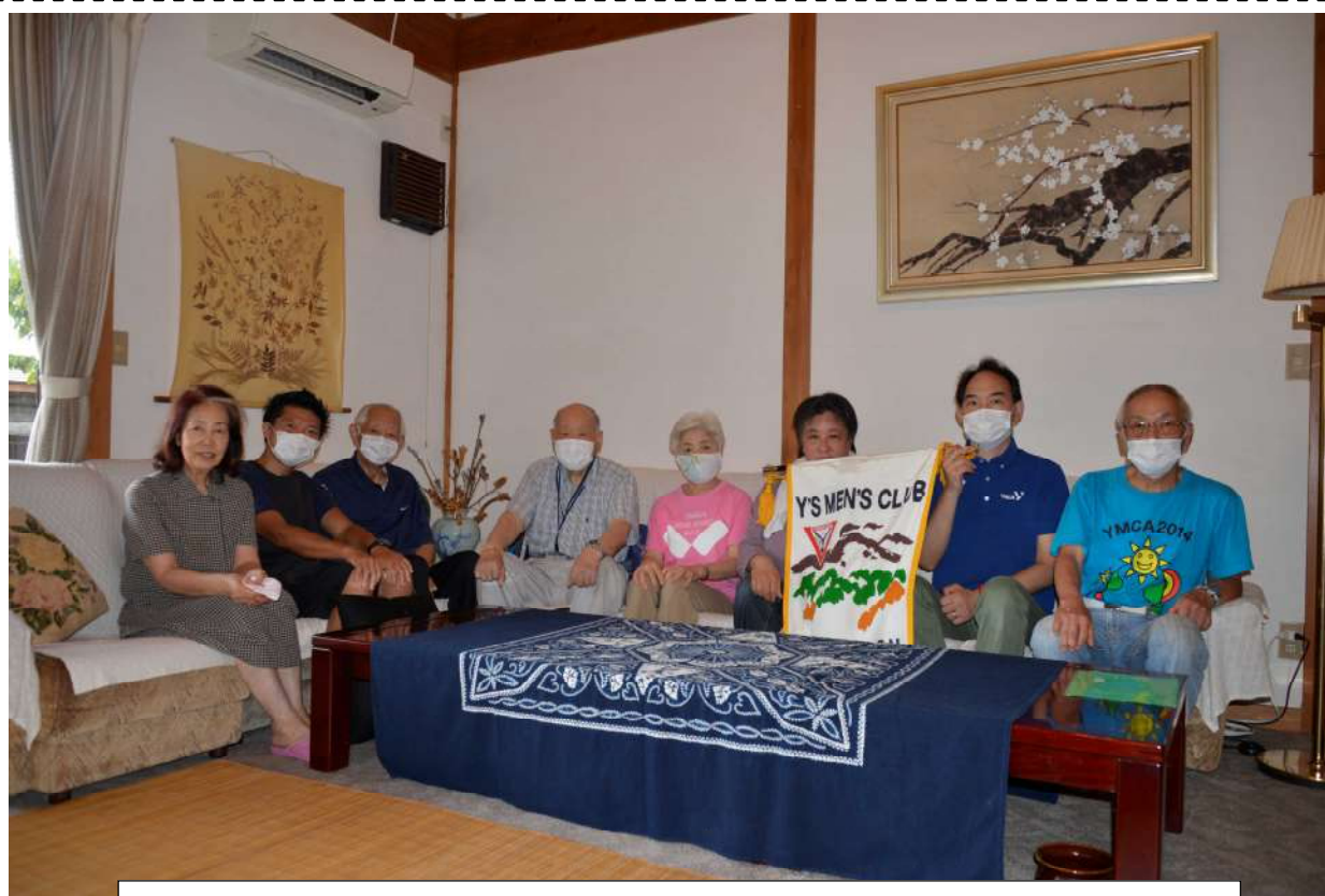
8月例会（塩谷キャンプ場での例会後、原田ワイズ宅訪問）8月24日（金）

子ども達は、成長し高校1年と小学6年生になりました。早いとこ一人立ちを願ってます。