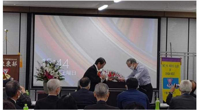
CS事業奨励金を吉野会長が受け取りました。