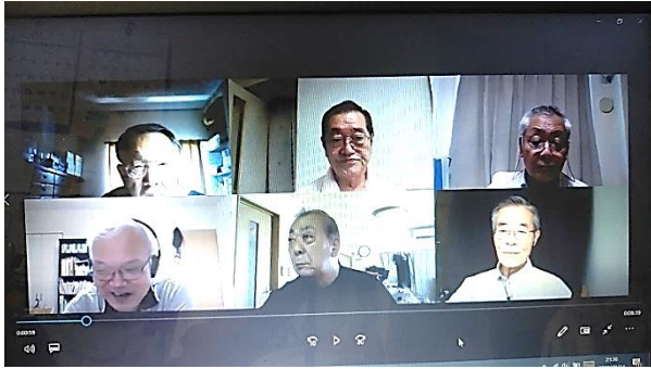
(画像は直近の9月9日(水)11:00~の第二例会風景)