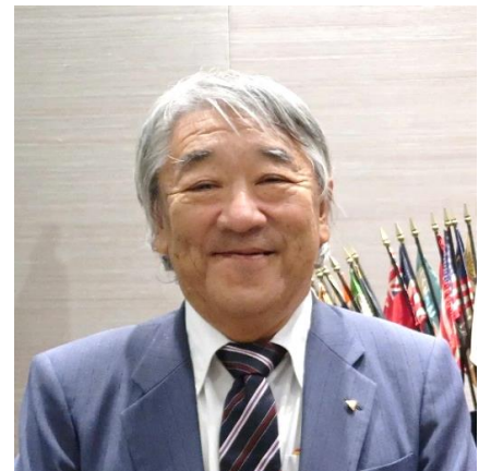
第41期 下田ワイズメンズクラブ会長