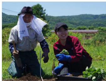
こんな小さな苗から大きな豆ができる