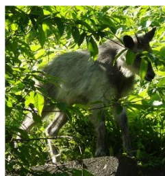
お！、モシカくん登場

もりおかクラブのブリテンに何回も登場してきましたが、なぜ今回もまた？と思われるでしょう。長岡家のある盛岡の岩山区はカモシカの生息地で、特に冬から春の食べ物が少ない季節にチャラの葉を食べに家のそばまでやってきます。ところが今回6月の新緑の季節、食べ物は山の中に多くあるでしょうに。またまた栗の木の下にやってきました。今回の登場場面では初めて新緑下の登場です。家の窓から撮影に成功その距離10M以内至近距離から写真を撮りました。