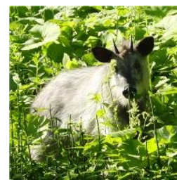
こちらに気づいた