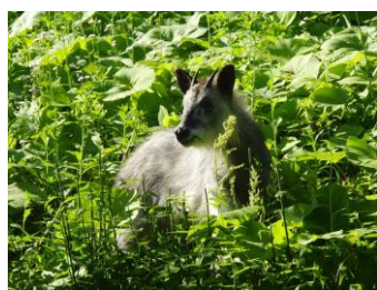
ん？そっちに何か見つけた？