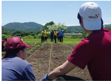
まっすぐかい？ん、いいよ。

程の深さまで掘らなければならず、深く掘るにつれて土は固くなるので苦労しました。作業が終わる頃には手の皮があちこち剥けて痛かったですが、頑張った証拠と考えると嫌な感じは全くありませんでした。農業において、この単純な作業を怠ってしまっただけでは収穫の喜びは大きいものにはなりません。私はここに農業の大変さとともに、面白さや奥深さを感じることができました。秋ごろの収穫も是非お手伝いさせていただきたいと思っています。6月21日のことでした