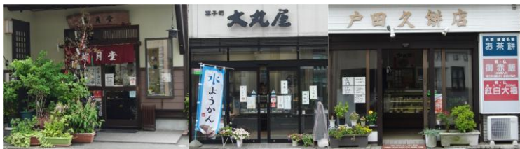
本町側から入るとすぐに和菓子とお餅のお店が3軒あります。

盛岡城の外堀の御門の一つで、大手御門(おおてごもん)がありました。南部藩の身分の高い家臣が多く住み武家屋敷があったそうです。明治時代、外堀も武家屋敷も取り壊され市街地になったそうです。これは戊辰戦争で敗北した南部藩に対するお仕置きでしょうか。現在は大手先(おてさき)と呼ばれていますが、盛岡市民でも「おてさき」としても「どこ？」という市民が大勢います。コロナ禍以前の例会場所であった北ホテルがある通りです。交通量はあまり多くはなかりと静かな通りで、和菓子屋、餅屋などがあり、川徳一番館もあります。大手先の名を冠する「大手先クリニック」という開業医もあります。