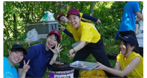
焼き肉？おなかぺっこぺこ、食べるぞ〜