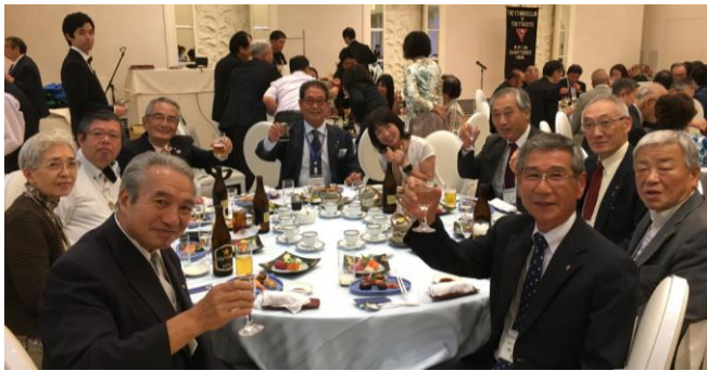
東京江東クラブ 60 周年祝会