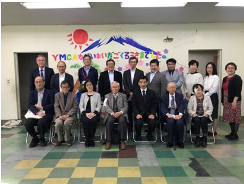
画像は今年 5 月 1 日に開かれた旧館最後の創立記念日早天祈祷会のときの記念写真です

https://congrant.com/project/yamanashiyymca/1553