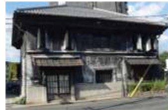
紙町、土蔵の建物食品販売のお店