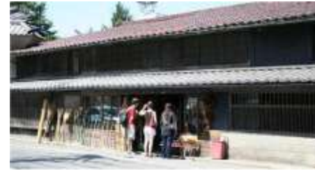
紺屋町、盛岡では有名な莫産丸(ござく)

天満宮は現存して学問の神様です。千代紙のお店や、お餅屋さん古い土蔵の店舗で食品を販売の店などがありました。後継者がなくどんどん閉店しています。昔ながらのイメージを模して新しい店舗が営業をしています。盛岡らしい通りになっています。