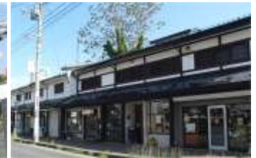
長屋をイメージした店舗