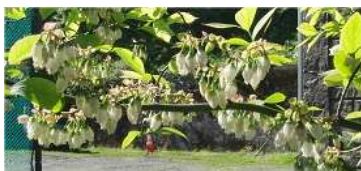
ブルーベリーの花、かんざしのようです