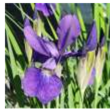
あやめのアップです