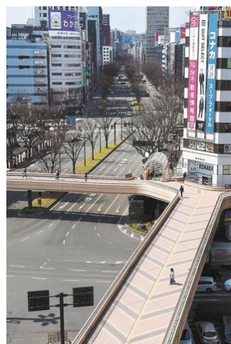
2020 人通りの消えた仙台駅