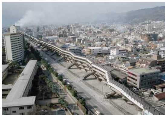
1995 阪神大震災の神戸