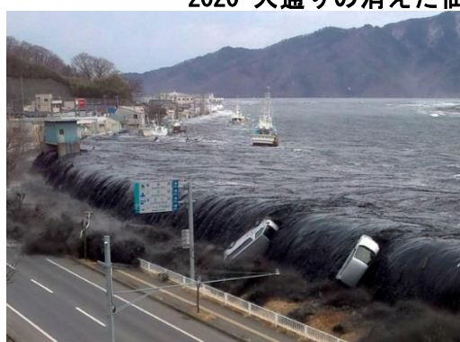
2011 東日本大震災の津波