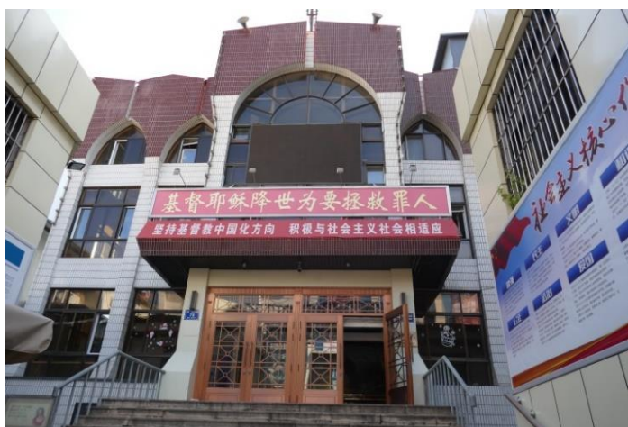
「太原基督教会」（プロテスタント教会）

後の教会はプロテスタントの教会である。どの教会も詳しい情報はほとんどなく、名称と写真だけにとどめざるをえなかった。太原市には10以上の教会があるようであるが、大部分はカトリック教会で、プロテスタントの教会は少ない。歴史的にみて、カ