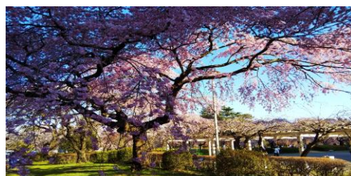
仙台榴ヶ岡公園の桜