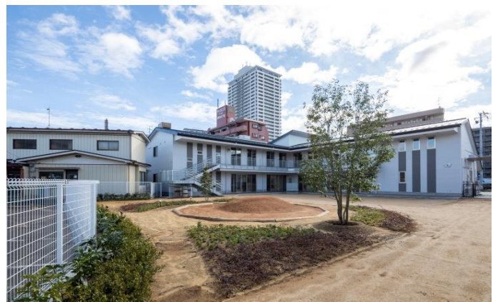
小さい築山とシラカシの木