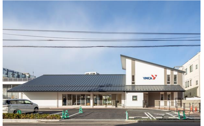
地下鉄長町駅徒歩5分です

自慢の園舎と子どもたちです。お近くにお越しの際は、ぜひお立ち寄りくださいと申し上げたいのですが、それもままなりません。いつの日かこの状況が改善された際、必ずお越し頂ける日が来ると信じて頑張ります。これからもご指導をお願いいたします。