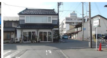
正面の住宅の右側が油町の入り口