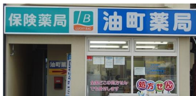
油町を冠した油町薬局

盛岡城下町の区画整理から取り残された通りで、入り口は段 差があるような変則三叉路です。また「油町」を冠している「油町 薬局」が内丸病院の向かいにあります。現在の住所は本町通り 1丁目です。