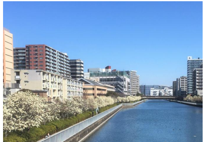
東陽町センター裏の白木蓮並木 (汐浜運河)