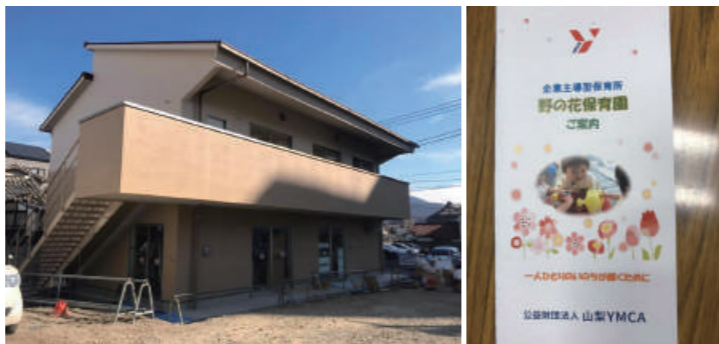
山梨YMCA「野の花保育園」の引き渡しが無事完了

「現在の苦しみは、将来わたしたちに現われるはずの栄光に比べると取るに足りない」(ローマの信徒への手紙8-18節) そう聖書が示すように、この苦しみは神様が私たちに必要なだけ与えてくれる試練なのだ、とポジティブに受け止め、しっかりと向き合っていきたいものです。2020年度は甲府ワイズは70周年、甲府21は30周年の大きな節目の年です。そんな年を新会館で迎えられる、こんな幸せな偶然は他にあるでしょうか。これからもYMCAは皆様と共にあります。5月2日に献堂式、6月には定期総会、11月にはバザーとチャリティーラン、すべてが盛會に終わりますように心よりお祈り申し上げます。