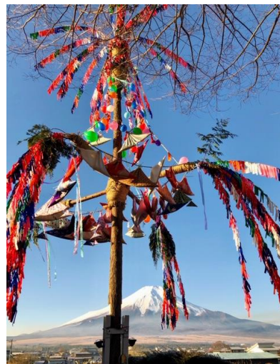
忍野村内野地区 古屋町内の 富士山と御神木

会員数 11名 例会出席 10名 例会出席率 91% ニコニコBOX 0円 累計 円